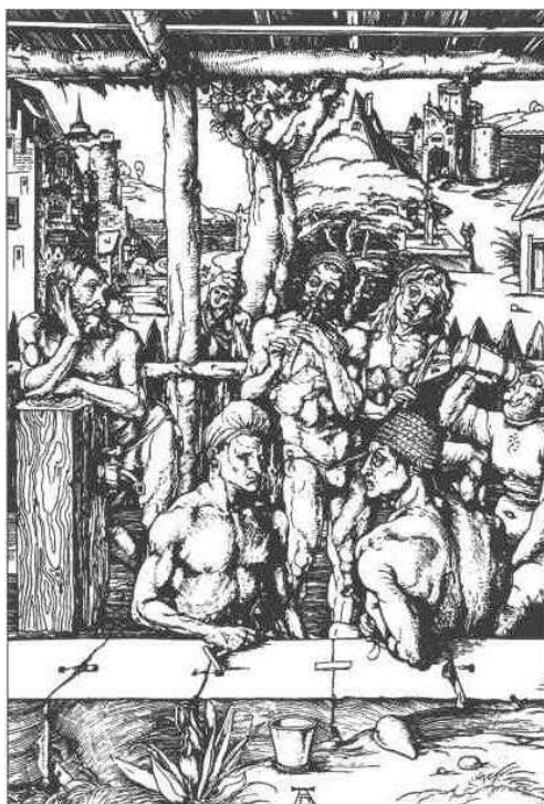
Gravure van Albrecht Dürer van een badhuis.

Eerst behandelde hij de gelijkzwevende stemming in de muziek. In 1691 had Andreas Werckmeister een oplossing gevonden voor een sinds mensenheugenis bestaand stemmingsprobleem in de muziek, dat erop neerkomt dat, in tegenstelling tot wat men volgens eenvoudige